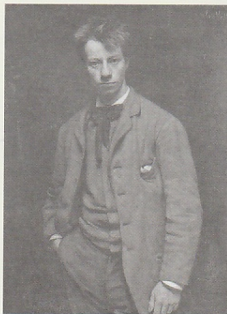
Albert Verwey, door Jan Veth.