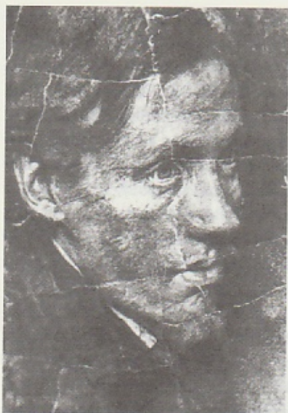
Portret van Willem Kloos door Willem Witsen, juni 1887. Kloos schonk de tekening aan Verwey, die de tekening voor zijn ogen verscheurde tijdens een ruzie in september 1888. Later lijmden Verwey de snippers weer aan elkaar. 1